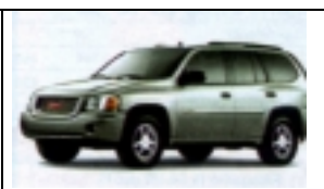
Standard SUV : Toyota Highlander o.ä. für 4 Erw. mit Gepäck , 4 Türen (Preise ähnl. wie Mini van)

Alle Fahrzeuge haben autom. Getriebe, Klimaanlage, Servobremsen und Servolenkung, Radio, CD-Player.