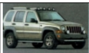
Midsize SUV Ford Edge o.ä. SUV für 2-3 Erw. mit Gepäck, 4 Türen

Für Fahrer 21-25 Jahren ist am Ort eine Zusatzversicherung abzuschließen (20$/Tag) . Soweit mehrere Fahren zw. 21 und 25 Jahre sind empfehlen wir unseren Tarif „Under 25“ der etwa 60-80€je Woche höher ist, aber dann günstiger als die am Ort zu zahlenden Zusatz-Versicherung.