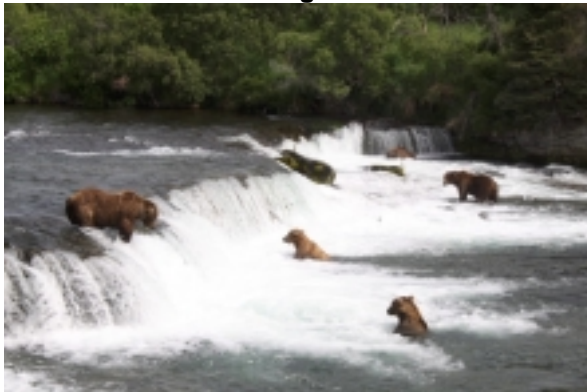
Brooks Falls

Sie können gut im Anschluss noch Brooks Falls Bärenbeobachtung buchen: