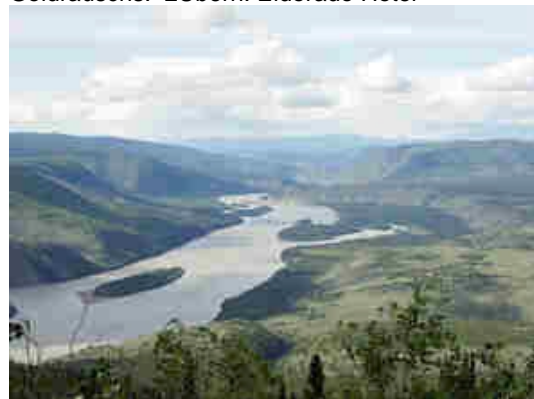
Yukon bei Dawson City

Es geht wieder zurück zum Klondike Hwy und dann weiter nach Norden in die berühmte Goldgräberstadt Dawson City, Zentrum des alaskanischen Goldrauschs. 2Übern. Eldorado Hotel