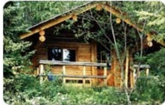
France Lake Lodge Cabin

Yukon Feeling. Die Lodge hat 5 rustikale Gäste Cabins mit Holzofen und Petroleum Lampen und WC. Duschen befinden sich in einem sep. Waschhaus mit Sauna.