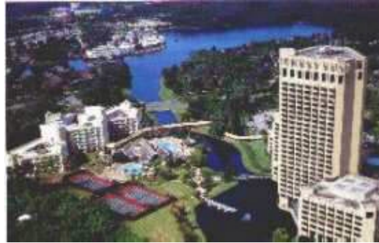
Lake Buena Vista nahe Disney World

An den sehr schönen Stränden der Golfküste führt die Strecke über Sarasota und St.Petersburg nach Tampa, dem größten Hafen an der Golfseite von Florida. Die letzten 100km ins Zentrum von Florida führen auf der Autobahn fast immer durch riesige Orangenplantagen. In Orlando wohnen Sie 3 Tage am International Drive. In der Nachbarschaft der Hotels haben Sie zahlreiche Geschäfte, Restaurants und Bars. Von hier aus kann man auch sehr gut mit dem Shuttlebus oder dem eigenen Mietwagen die zahlreichen Attraktionen erreichen.