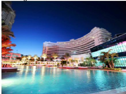
3 Übernachtungen im ***** Hotel Fontainebleau mit einer großzügigen Gartenanlage direkt am schönen

Nach Ankunft übernehmen Sie am Flughafen Ihren Mietwagen und fahren zu Ihrem Hotel in Miami Beach.