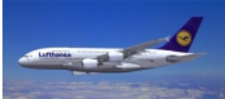
Lufthansa A380 Nonstop Frankfurt-Miami (Business Class gegen Aufpreis mgl.)

Wir haben hier eine ganz besondere Reise zusammengestellt für den Gast, der das Besondere liebt. Sie wohnen unterwegs in Spitzenhotels, Ihr Mietwagen ist ein Cadillac DTS oder ähnlich und fliegen mit dem modernen Airbus A 380 nach Miami.