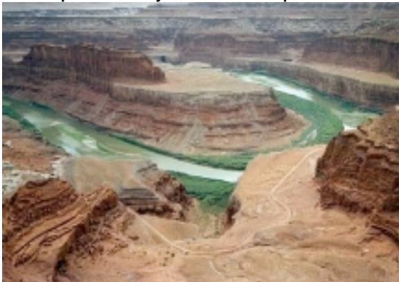
Deadhorse Statepark bei Moab

Durch den Süden des Staates Utah geht es weiter nordwärts in das kleine Städtchen Moab, das der Ausgangspunkt für den Arches Nationalpark und Canyonlands Nationalpark ist.