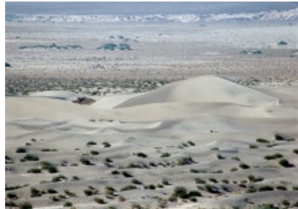
Sanddünen im Death Valley