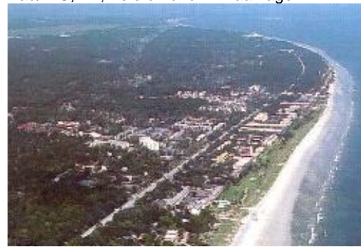
Forest Beach Hilton Head Island 17.+18.+19. Tag Hilton Head Island

Direkt am Sandstrand Forest Beach gelegenes, gehobenes Mittelklassehotel mit Restaurant, Poolbar, nahe eines Shoppingcenters. 202 Zimmer mit Bad/WC, TV, Telefon und Klimaanlage.