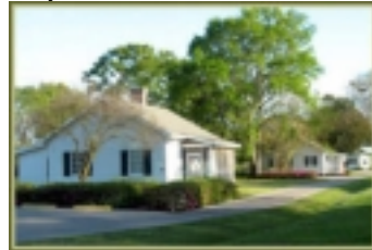
Oak Alley Plantation Cottages

liegt unmittelbar hinter dem Mississippi-Damm und wird liebevoll die „Grande Dame“ an der Riverroad genannt. Die alte Zufahrt zum Plantagenhaus wird von 300 Jahre alten Eichen gesäumt. Die Unterkunft ist in kleinen Cottages, die um 1880-1890 als Wohnungen für die Bediensteten erbaut wurden. Es stehen vier dieser kleinen Häuser zur Verfügung. Oak Alley Plantation liegt ganz einsam. Genießen Sie diese Ruhe und den malerischen Sonnenuntergang über den Mississippi. Country Frühstück wird im Restaurant von Oak Alley serviert.