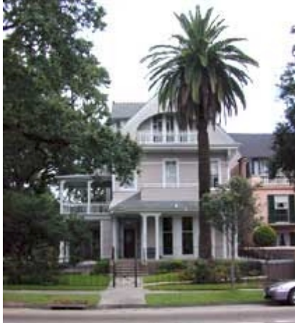
Grand Victorian Inn B&B

Nach der Ankunft Fahrt in die Innenstadt. 2 Übernachtungen im Grand Victorian Inn B&B