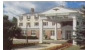
Hotel Williams Inn Williamstown

Am malerischen Lake George entlang führt die heutige Etappe in den nordwestl. Zipfel von Massachusetts, in die wunderschönen Berkshire Mountains, nach Williamstown Hotel The Williams Inn. Im Sommer finden in den Berkshire Mnts. Musikfestivals großer Orchester statt.