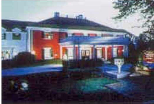
Übernachtung im Country Inn Dan'l Webster

Neben dem schönen Segelhafen mit attraktiver Promenade und erstklassigen Restaurants, hat man hier zahlreiche pompöse Herrenhäuser aus der ersten Hälfte des 20. Jahrhunderts. Hier baute sich der amerikanische Geldadel elegante Sommersitze, die man jetzt zum Teil besichtigen kann. Anschl. Kurze Weiterfahrt nach Sandwich auf Cape Cod.