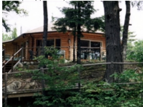
Mersey River Chalet

Übern. im Mersey River Chalets (STD) bzw. Pines Golf Resort (SUP) (2 Übern.)