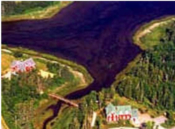
Little Shemogue Inn

Landschaft ständig. Übern. im wunderschön gelegenen Little Shemogue Country Inn (2 Üb.) (STD und SUP)