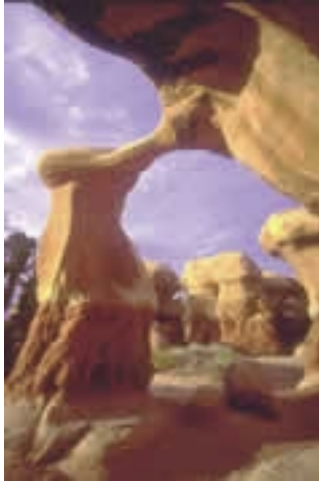
Im Escalante Canyon – Hole in the Rock