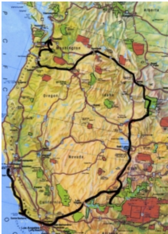
M23a ab Los Angeles

Auf dieser Route besuchen Sie die beliebtesten Nationalparks im Südwesten und Nordwesten der USA . Bei dieser Tour ist sogar der Grand Canyon Northrim – der ansonsten nur selten eingeschlossen ist – enthalten.