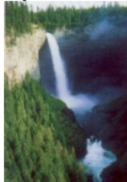
Helmcken Falls, Wells Gray Park

sind nur per Kanu zugänglich. Sie wohnen in der Clearwater Lodge.