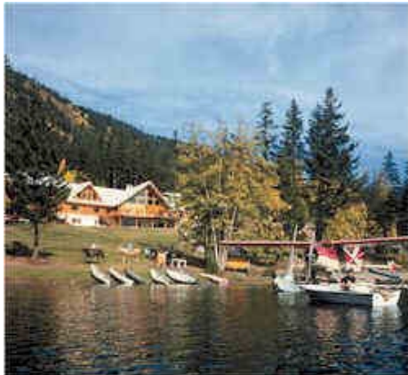
Tyax Mountain Lake Resort