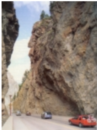
Sinclair Canyon Kootenay NP

Ein kurzes Stück geht es in Richtung Banff weiter, dann zweigen Sie aber wieder nach Westen ab und über den Vermillon Pass kommen Sie zum Kootenay Nationalpark. Sie sollten zwischendurch an den gekennzeichneten Aussichtspunkten halten, es lohnt sich.