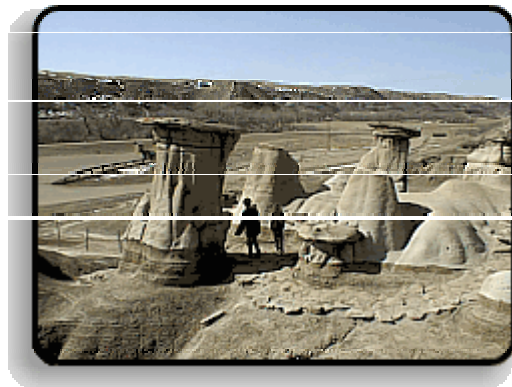
Hoodoos bei Drumheller

Durch den Süden der Provinz Alberta, einem landwirtschaftlich genutzten Gebiet kommen Sie zum Dinosaur Provinzpark. Die Landschaft hier könnte auch auf einem anderen Planeten liegen, so fremd wirkt sie. Hier wurden zahlreiche Dinosaurierskelette gefunden. Auf Lehrpfaden lernt man mehr aus der Zeit der Riesenechsen kennen.