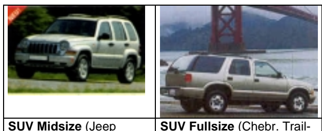
SUV Midsize (Jeep

Warum nicht mal im Urlaub ein SUV Fahrzeug fahren ?