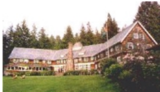
Lake Quinnault Lodge

Im südlichen Teil ist in der wunderschönen Lake Quinnault Lodge eine weitere Übernachtung.