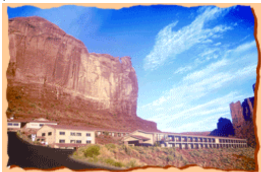
Übernachtung in der Gouldings Lodge (bei STD und SUP Kat.)

Es geht wieder nach Utah und zum nächsten Höhepunkt, dem Monument Valley mit seiner grandiosen Kulisse.