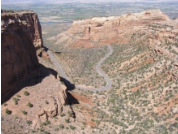
Fruity Canyon bei Grand Junction