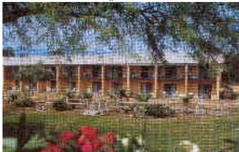
Furnace Creek Ranch. (bei STD und SUP Kat.)

Bei Laughlin erreichen Sie Nevada und später dann Californien. Durch die Avawatz Mnts kommen Sie von Süden zum Death Valley. Sie wohnen mitten im „Tal des Todes“ in der