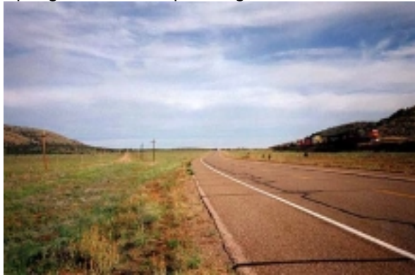
Die alte Route 66 bei Seligman

Heute übernachten Sie in dem kleinen Ort Peach Springs in der Hualapai Lodge.