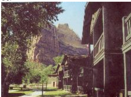
Zion Nationalpark Lodge innerhalb des Nationalparks

Die Fahrt geht zuerst durch eintönige Wüste, aber bald schon umrahmen steile Granitfelsen das schmale Tal des Virgin Rivers. Sie übernachten in Springdale oder bei Superior in der