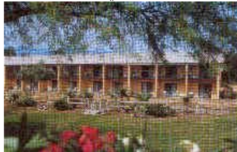
Furnace Creek Ranch. (bei STD und SUP Kat.)

Bei Laughlin erreichen Sie Nevada und später dann Californien. Durch die Avawatz Mnts kommen Sie von Süden zum Death Valley. Sie wohnen mitten im „Tal des Todes“ in der