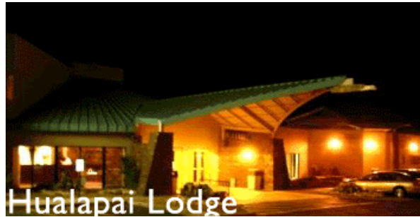
Sie wohnen in der Hualapai Lodge

Amerika Reise Center Mercator Reisen Tel. 02151-801816 Fax: 02151-20972 Stephanstr. 30a 47798 Krefeld email: mercatorreisen@t-online.de