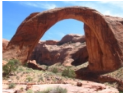
Rainbow Bridge am Lake Powell

6.Tag Lake Powell Heute besteht die Möglichkeit zu einer schönen Schiffstour auf dem Lake Powell zur Rainbow Bridge.