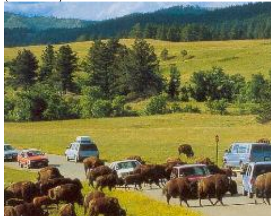
im Custer State Park

Zuerst geht es durch das Grasland Wyoming zu den Black Hills in South Dakota mit dem berühmten „Präsidentenberg“ Mt. Rushmore und dem Crazy Horse Mnt. Der Custer State Park ist ein Teil der Black Hills. Sie übern. in der State Game Lodge Custer State Park (STD+SUP)