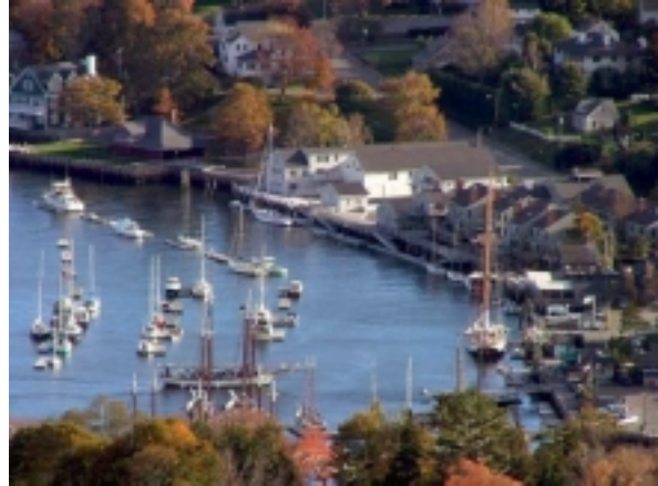
Camden , Maine

Die ganze Tagesstrecke führt mehr oder weniger nah an der attraktiven Küste entlang.