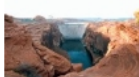
Glen Canyon Damm.

Am Südrand des Grand Canyons entlang geht früh morgens die Fahrt ins Indianerland der Navajos und dann durch den landschaftlich sehr reizvollen Norden Arizonas zum Monument Valley, das mit seinen einmaligen Felssäulen Kulisse für zahlreiche Westernfilme war. Nach der Rundfahrt durch das Monument Valley geht es zum Teil auf der gleichen Strecke wieder zurück über Kayenta nach Page am