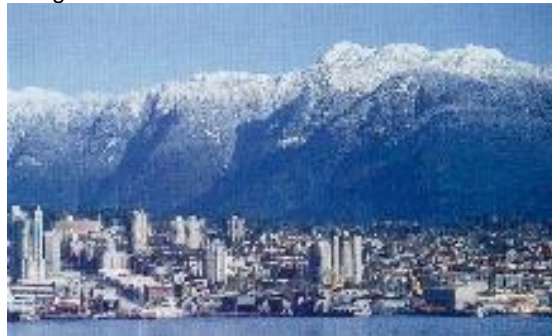
Blick auf Vancouver

Mit der Fähre geht es wieder zurück um Festland. Diese südlichere Route führt sehr malerisch durch die Gulf Islands und mit etwas Glück kann man sogar von Bord aus Wale beobachten. In Vancouver ist dann anschließend eine Stadtrundfahrt und den Ausklang bildet ein Farewelldinner an der Capilano Hängebrücke. Übern. im Coast Coal Harbour Hotel.