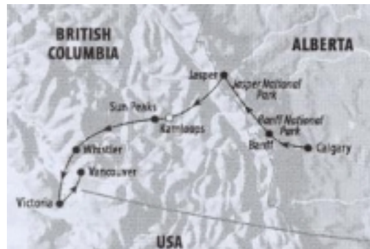
Route in West-Canada

Transfer zum Flughafen und früh morgens Flug nach Calgary, Transfer zum zentral gelegenen Hotel Delta Bow Valley. Der Rest des Tages steht zur freien Verfügung.