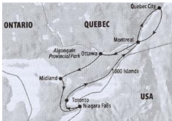
Die Route durch Ost Canada

Termine 2012: Juni 3 10 Juli 1 8 29 Aug 12 19 26 Sep 2 9 16