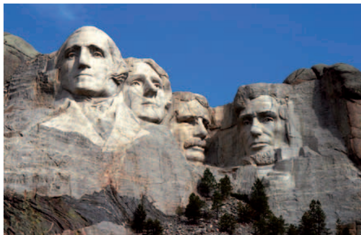
In Stein gehauene Präsidenten: George Washington, Thomas Jefferson, Theodore Roosevelt und Abraham Lincoln

Durch die malerischen „Black Hills“ geht es zum „Crazy Horse Memorial“, der größten Felsskulptur der Welt. In unmittelbarer Nähe befindet sich der Mount Rushmore mit den bekannten, in Fels gemeißelten Präsidentenköpfen. Am Nachmittag erreichen Sie