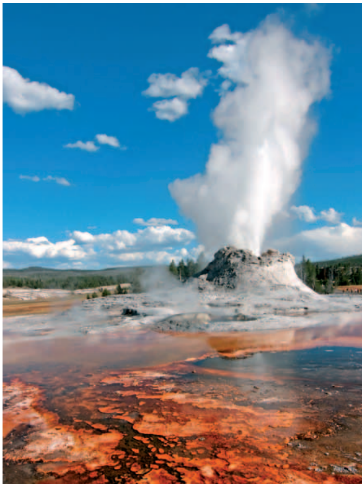
Castle Geysir im Yellowstone N.P.

Gegen Mittag Ankunft und Weiterreise zu Ihrem Heimatort.