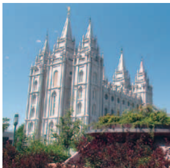
Mormonentempel in Salt Lake City

und zur Hauptstadt der Mormonengemeinde gemacht. Sie gehört zu den saubersten und sichersten Städten Amerikas. Die größte Sehenswürdigkeit ist der «Temple Square», das religiöse Zentrum der Mormonenkirche. Im Westen der Stadt liegt der größte Salzsee Amerikas. Übernachtung Hotel „Shilo Inn“.