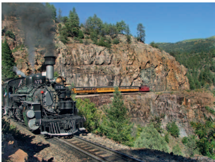
Historische Dampfisenbahn zwischen Durango und Silverton