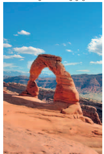
Delicate Arch, Arches N.P.

Es geht in südlicher Richtung aus den Bergen heraus und in die wüstenartige Landschaft um Salt Lake City. 1847 wurde die Stadt vom Mormonenführer Brigham Young gegründet