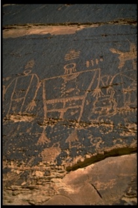
1000 year old rock art panel