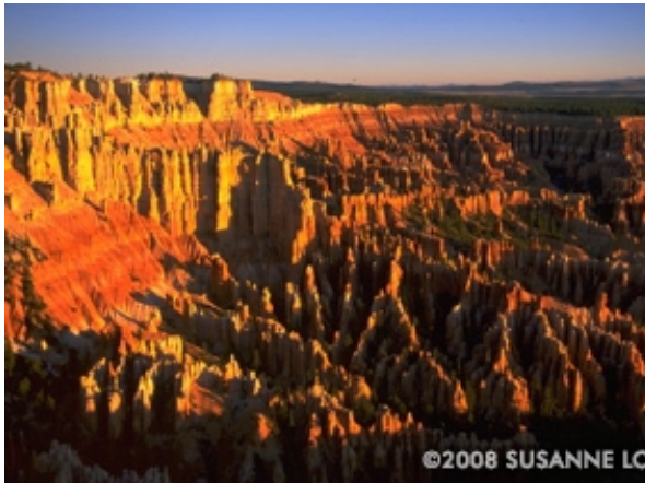
Bryce Canyon NP sunrise

Fairyland Loop - 4-5 Std, ca. 8 miles/ 13 km, Höhenunterschied: +/- 300m