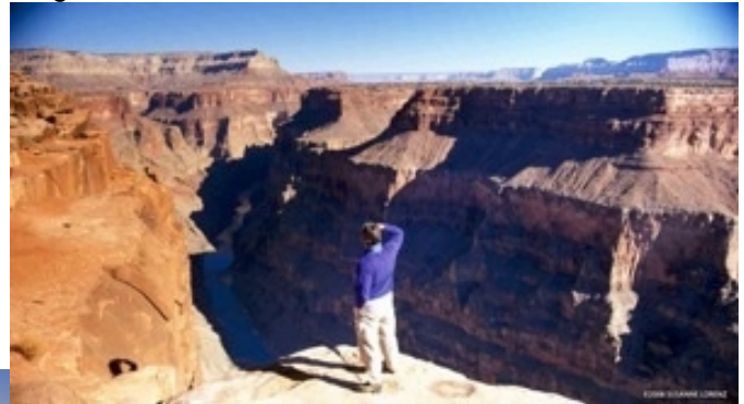
Grand Canyon NP Toroweap overlook

Tagesstrecke Fahrt :270km, 170m, 4.5 Std.