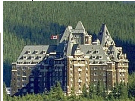
Fairmont Banff Springs Hotel